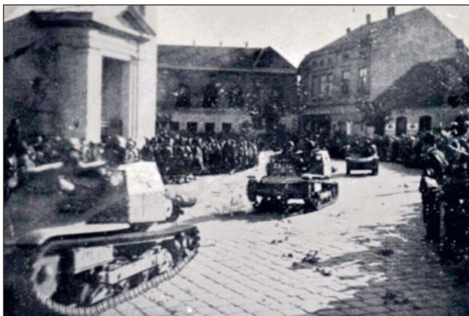
Německé lehké tanky na breclavském náměstí 8. 10. 1938.

V září došlo k vyhlášení všeobecné mobilizace, která byla vyhlášena rozhlasem 23. 9. a vylepováním mobilizačních vyhlášek, a již v noci byly z Břeclavského nádraží vypravovány první vlaky s mobilizovanými záložníky směřujícími ke svým útvarům. Do strážení důležitých mostů na katastru města byli dokonce na-