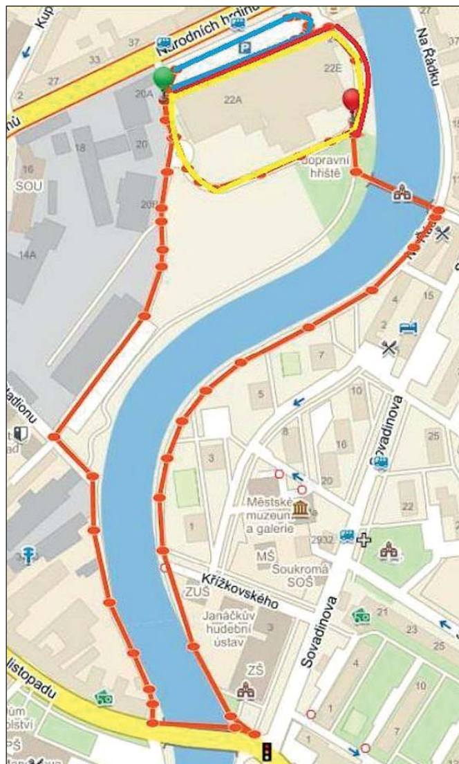
Trasa Běhu kolem Dyje. Červená barva značí okruh 1670 m, který se poběží třikrát. Žlutá barva zvýrazňuje 500 m, modrá 200 m.