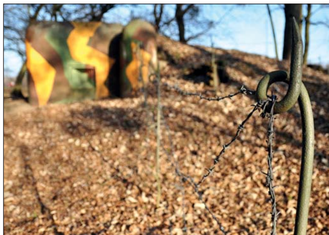
Některé řopíky obnovili nadšenci z klubu vojenské historie (na snímku řopík na Pohansku).

Při prvním vážném ohrožení bezpečnosti státu v květnu 1938 byly před budované linie pevností nasazeny jednotky Stráže obrany státu. Podle Vládního nařízení o jednotkách SOS byla jejich úkolem „ochrana neporušitelnosti státních hranic, nedotknutelnosti státních hranic, nedotknutelnosti státního území...“ a podle jiného předpisu „trvalé strážení státních