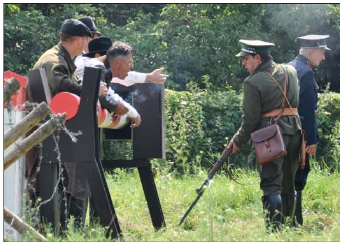
Období mobilizace si každoročně připomínají na Pohansku členové KVH Břeclav nejen bojovými ukázkami.