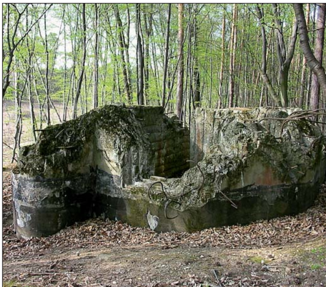
Trosky pevnůstky naproti hájovny nad Poštornou, kterou německá armáda vyhodila do povětří při zkoumání odolnosti opevnění. 2003.

Nebyly to ale jen výstavba opevnění a vojenské nasazení jednotek SOS, kterými reagovala republika na fašistické nebezpečí. Současně došlo k vzednutí vlasteneckého citění českého obyvatelstva. Tak 25. května se na náměstí T. G. Masaryka konala velká manifestace, organizovaná breclavským studentstvem, která vrcholila slibem věrnosti Československé republice. Největší všelidovou manifestací na obranu republiky pak byly na Břeclavsku národopisné slavnosti, které se konaly ve dnech 13. a 14. srpna na sokolském stadionu.